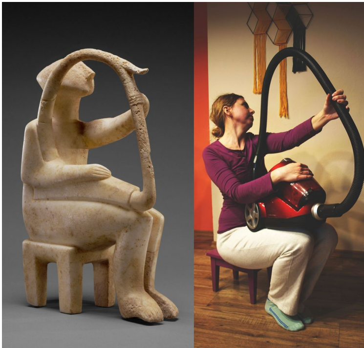
Male Harp Player of the Early Spedos Type, 2700–2300 B.C., Cycladic. Marble, 14 1/8 x 11 1/16 in

Un tableau. Trois objets. A vous de jouer!