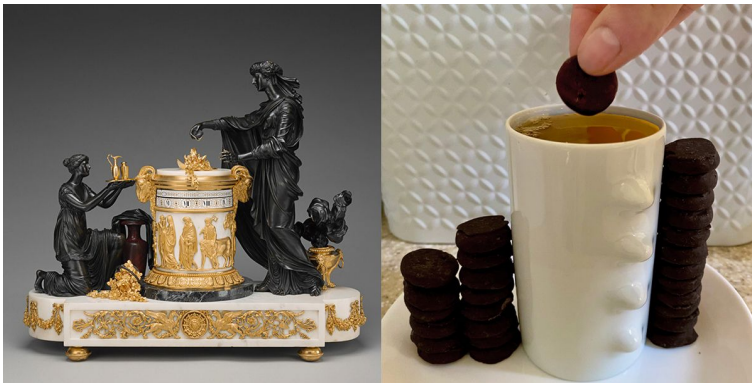
Mantel Clock, about 1785, clock case attributed to Pierre-Philippe Thomire, design attributed to Jean-Guillaume Miotte, clock dials enameled by Henri-François Dubuisson. Gilt and patinated bronze; enameled metal; vert Maurin des Alpes marble; white marble, 21 × 25 1/8 × 9 1/4 in.