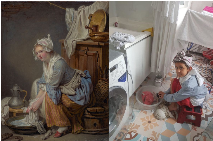
1761, Jean-Baptiste Greuze. Oil on canvas, 16 x 13 in.